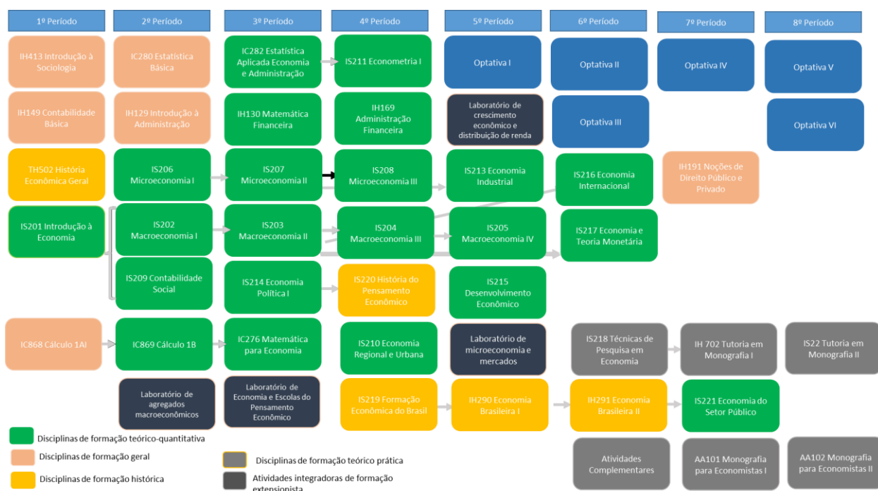
Figura 2 – Representação gráfica matriz curricular 2023-1

Vale destacar que as disciplinas optativas também desempenham papel importante nessa formação ao complementar e ampliar os conteúdos das disciplinas obrigatórias. Disciplinas optativas de Análise Multivariada e Econometria II, por exemplo, oferecem esse aspecto. Em mercados e até mesmo na área de finanças, disciplinas voltadas para análise de projetos, sua elaboração, avaliação e computação de custos. E na área de dados, a inclusão recente de disciplinas da Ciência da Computação.