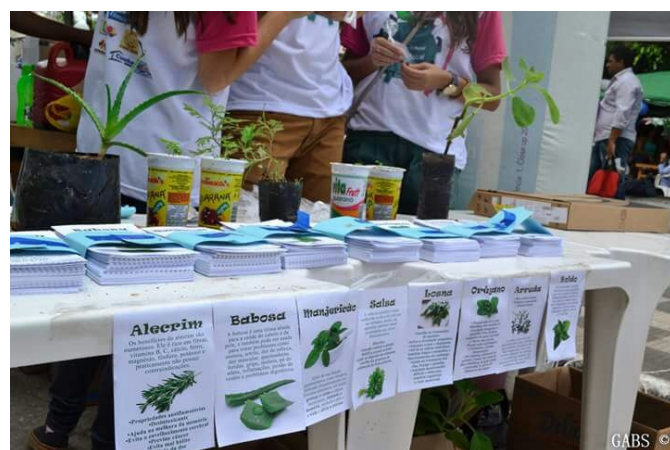
Tenda do PET-Floresta, que contribuiu com a distribuição de mudas em copos reciclados, de espécies medicinais, tais como alecrim, boldo, babosa, manjeriço, dentre outras.

A comissão organizadora sente-se satisfeita com os resultados obtidos pelo evento, pois o maior objetivo foi aproximar a Universidade da comunidade local, possibilitando troca franca de informações e estímulo ao desenvolvimento do município, com principal enfoque na melhoria da saúde e qualidade de vida da população local.