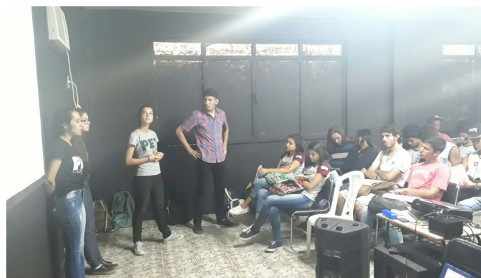
Na imagem, membros do grupo PET-Floresta durante a apresentação para os estudantes.

Em 2018 o grupo organizará a visita aos colégios em dois momentos, sendo a primeira no início do ano e terá como objetivo apresentar aos alunos a importância de se inscrever para o Enem, enquanto que a segunda será realizada próximo à data da prova e terá o objetivo de esclarecer eventuais dúvidas relacionados a mesma.