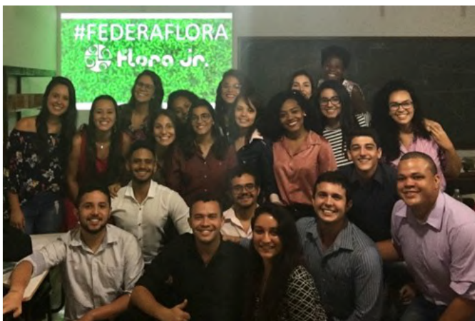
Membros da atual gestão da Flora Júnior, na última reunião que antecedeu a Federação que ocorreu em 11/11/2017.

A federação veio para coroar o esforço coletivo, mais intensamente nos últimos 2 anos, de se atualizar nas práticas de mercado e consolidar sua gestão interna, voltando suas ações para a conquista de novos projetos e aumento da visibilidade no estado, cumprindo assim sua missão de “fomentar o espírito empreendedor dos estudantes de Engenharia Florestal, potencializando sua formação de modo a oferecer serviços de qualidade para a sociedade”.