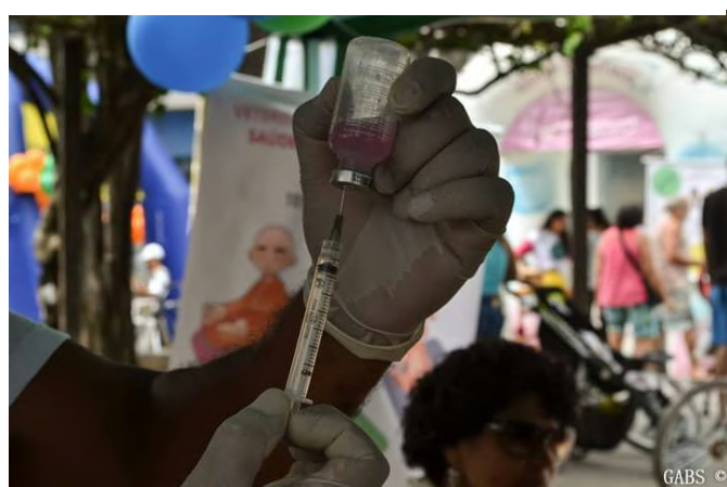
Vacina se preparando para ser aplicada nos cachorros e gatos que participaram do evento.

Parabéns ao PET de Medicina Veterinária por essa iniciativa incrível, levando saúde e informação a toda população de Seropédica!