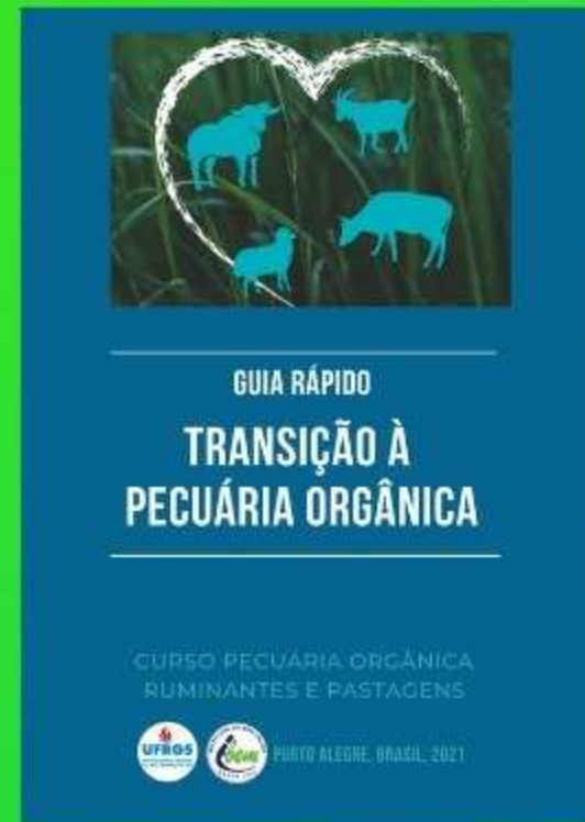
E-book: GUIA RÁPIDO TRANSIÇÃO A PECUÁRIA ORGÂNICA